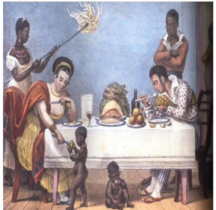
DEBRET, Jean-Baptiste. Um jantar brasileiro . Cerca de 1830. Aquarela sobre papel, 16 x 22 cm, Rio de Janeiro.

A gravura de Jean-Baptiste Debret, publicada na obra “Viagem pitoresca e Histórica ao Brasil, 1816–1831”, é parte do registro do artista, integrante da Missão Artística Francesa do século XIX, sobre o cotidiano brasileiro do período. A pintura evidencia a cultura escravocrata na sociedade brasileira ao expressar: